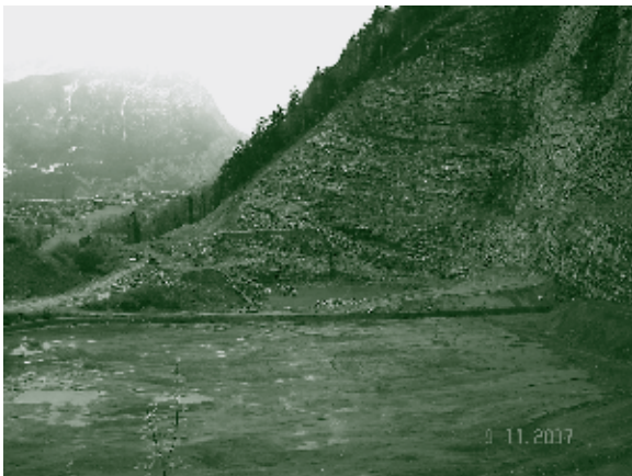
Sicht auf künftige Deponie Etappe III

2007 gab der Verwaltungsrat die Planungsarbeiten für die Deponie III frei, um die vertraglichen Verpflichtungen auf Abnahme von Kehrichtschlacken auch in Zukunft erfüllen zu können.