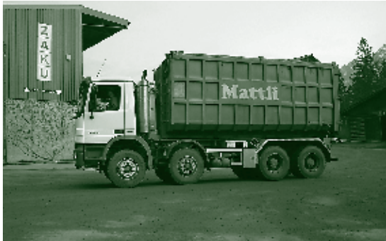
Transportfahrzeug Euronorm 05

Die breite Diskussion über die Frage, welche Transportart die ZAKU für ihre Abfall- und Schlackentransporte nach und von Horgen wählen soll, verhinderte die notwendige öffentliche Ausschreibung des Transportauftrags. Die gesamten Transportleistungen erfolgten deshalb als Übergangslösung auf der Strasse. Die beauftragte Unternehmung setzte dafür einen Lastwagen ein, der die Euronorm 05 erfüllt. Der Entscheid der Generalversammlung der ZAKU, eine Ausschreibung vorzunehmen, die für alle Transportmittel offen ist, erging erst am 19. November 2007. Der Verwaltungsrat wird diesen Entscheid 2008 umsetzen können.