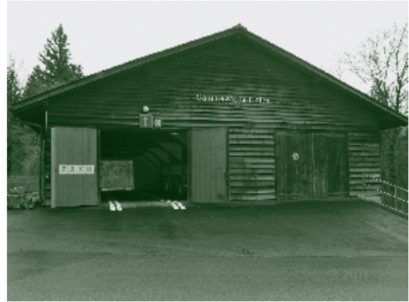
Sammelstelle Eielen bei der Eröffnung im März 2007