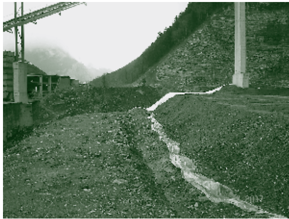
Erste Bau-Etappe der Rekultivierungsschicht in der Etappe II

2007 gab der Verwaltungsrat die Planungsarbeiten für die Deponie III frei, um die vertraglichen Verpflichtungen auf Abnahme von Kehrichtschlacken auch in Zukunft erfüllen zu können.