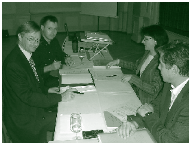
19.11.2007 Gründungsversammlung ZAKU / Zentrale Organisation für Abfallbewirtschaftung im Kanton Uri

Dank der motivierten Mitarbeiterinnen und Mitarbeiter konnte die ZAKU 2007 die ambitionierten Ziele erreichen. Allen Beteiligten gebührt deshalb der herzliche Dank der Organe der ZAKU.